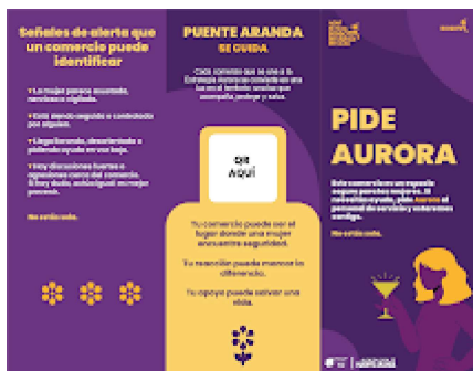
Folleto 1.png 101K