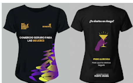
camisafin (2).png 1824K