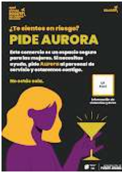
poster final.png 167K

Solicitudes Prensa <piezasalpa@gmail.com>